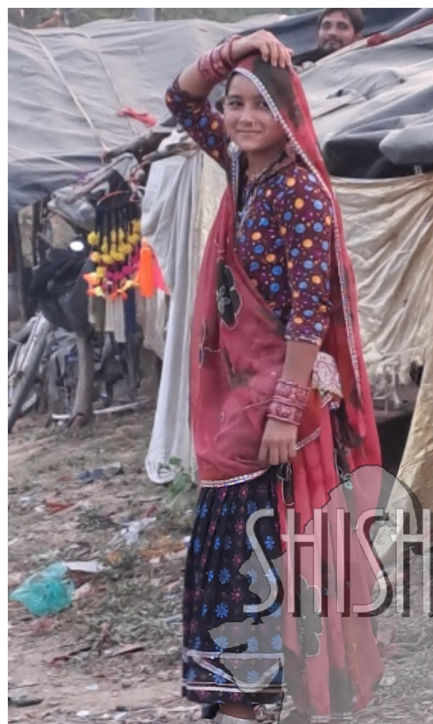
Zigeuner kinderen in hun tentenkamp in Anklav.