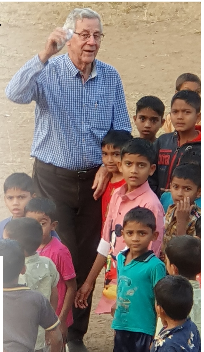
Als scheidsrechter tussen zijn jongens.

In Singlotti droomde father Castiella van een voetbalveld, dat hij inmiddels ook heeft aangelegd. Hij speelt nu scheidsrechter tijdens de matches van 'zijn' jongens. Nu droomt hij ervan een groot scherm te installeren, om hen te vergasten op films tijdens de lange weekends ver weg van huis.