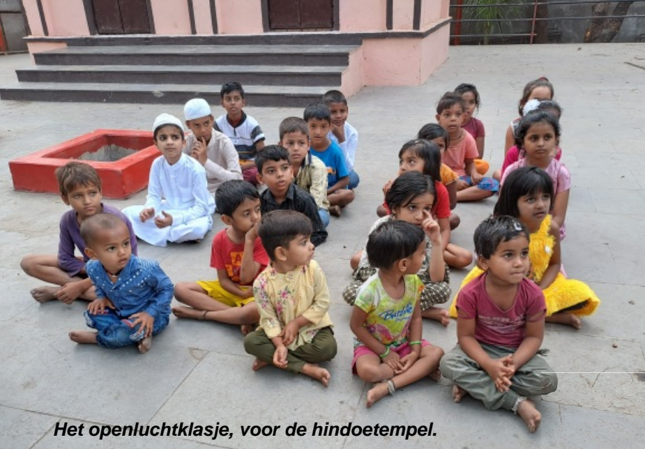
Het openluchtklasje, voor de hindoetempel.