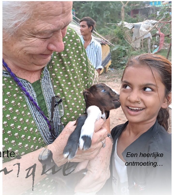
Een heerlijke ontmoeting...

Wanneer u als meter of peter betrokken bent bij deze veranderingen, ontvangt u hierover binnenkort een brief.