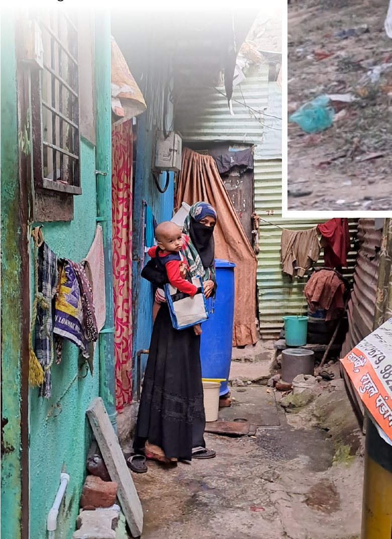
Een steegje in de sloppenwijk.