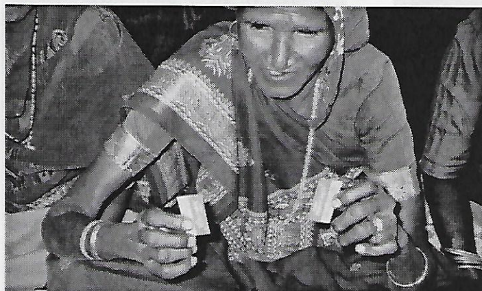
...elles me montrent leur 'trousse médicale': une petite lame de rasoir!

Nous sommes dans le Sud-Gujurat, le monde des Adivasis (population autochtone primitive, encore animiste). Ici, savoir lire et écrire est le privilège d'une infime minorité. Les autres tirent leur savoir ancestral d'une tradition orale qui leur a tout appris sur la forêt, leur mère nourricière. Mais chaque jour la forêt s'amenuise, le défrichage est constant, la replantation plus que sporadique.