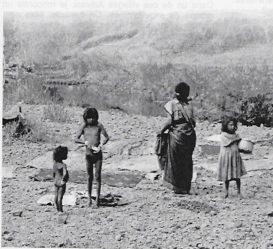
...les enseignants savent combien leur jeune public est 'volatile'...