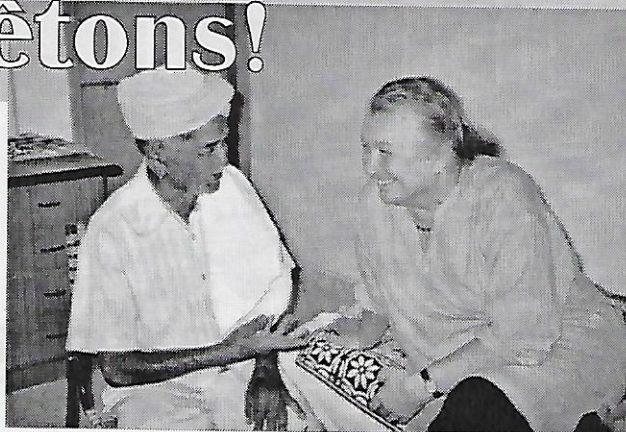
...on me présente le Boa du village...

C'est cet espoir qu'ils transmettent désormais aux plus jeunes, c'est leur joie qui continue à nous motiver.