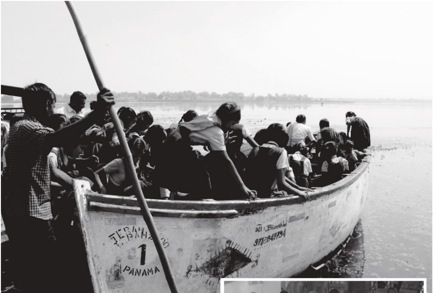
Un tour en bateau avec les enfants sur le lac à Varasda..