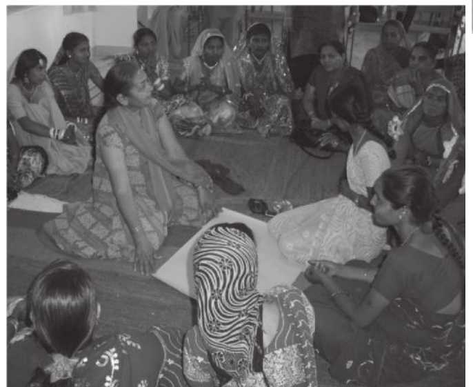
Femmes dalites réunies à Palanpur.

Notre parrainage permettra d'ajouter un peu de confort matériel, l'accès à l'eau (en hiver à l'eau chaude), un peu plus de livres et peut-être même des bancs... Mais leur joie et leur confiance nous sommes déjà tous invités à aller les partager avec eux!