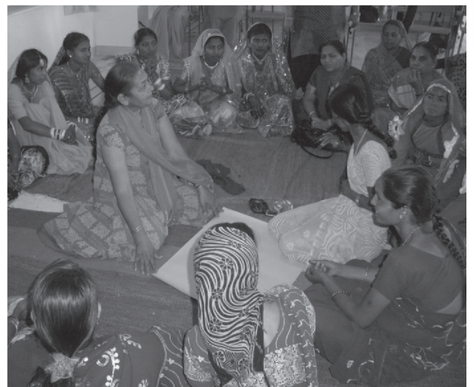
Dalit-vrouwen overleggen in Palanpur.

Met onze peterschappen zullen we de kinderen daar een beetje materieel comfort kunnen bezorgen, toegang tot water (en warm water in de winter), wat meer leerboeken en misschien zelfs banken... Maar nu al nodigen zij ons allen uit om hun vreugde en hun vertrouwen met hen te komen delen!