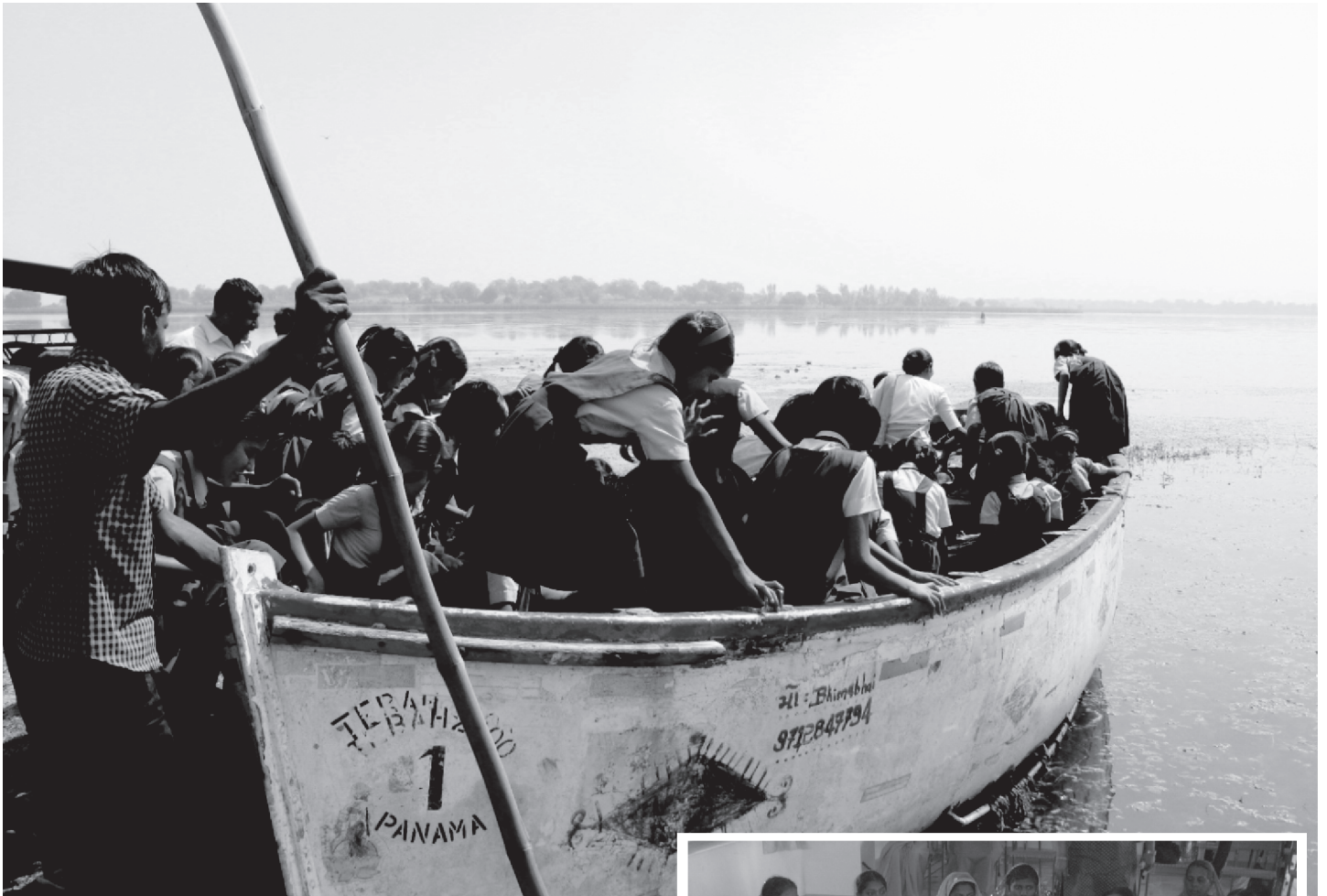
Een boottochtje met de kinderen op het meer van Varasda.