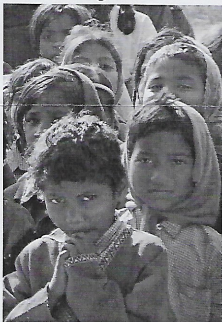
Samen de kou vergeten.