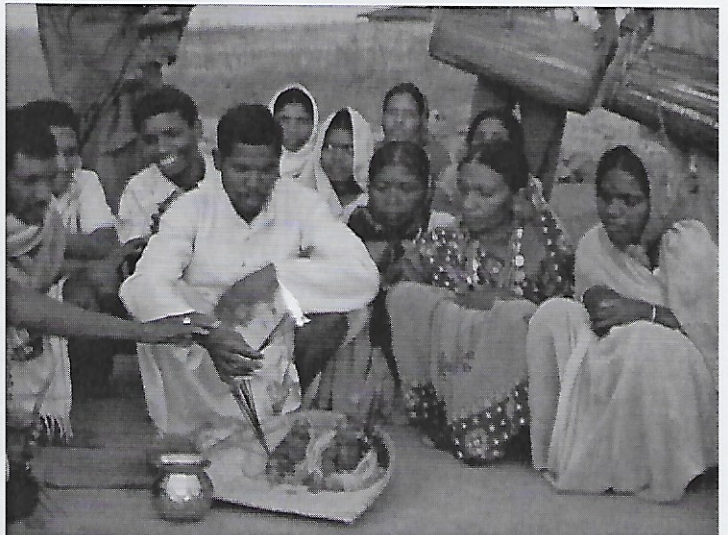
Offers voor de 'God' van het dorp.

Plots moeten we stoppen voor een kleine processie: een dorp gaat rond met 'zijn God'. Hij wordt gedragen door de vrouwen en omringd door de kinderen, terwijl de mannen volgen op het ritme van een tamboerijn en belletjes. De