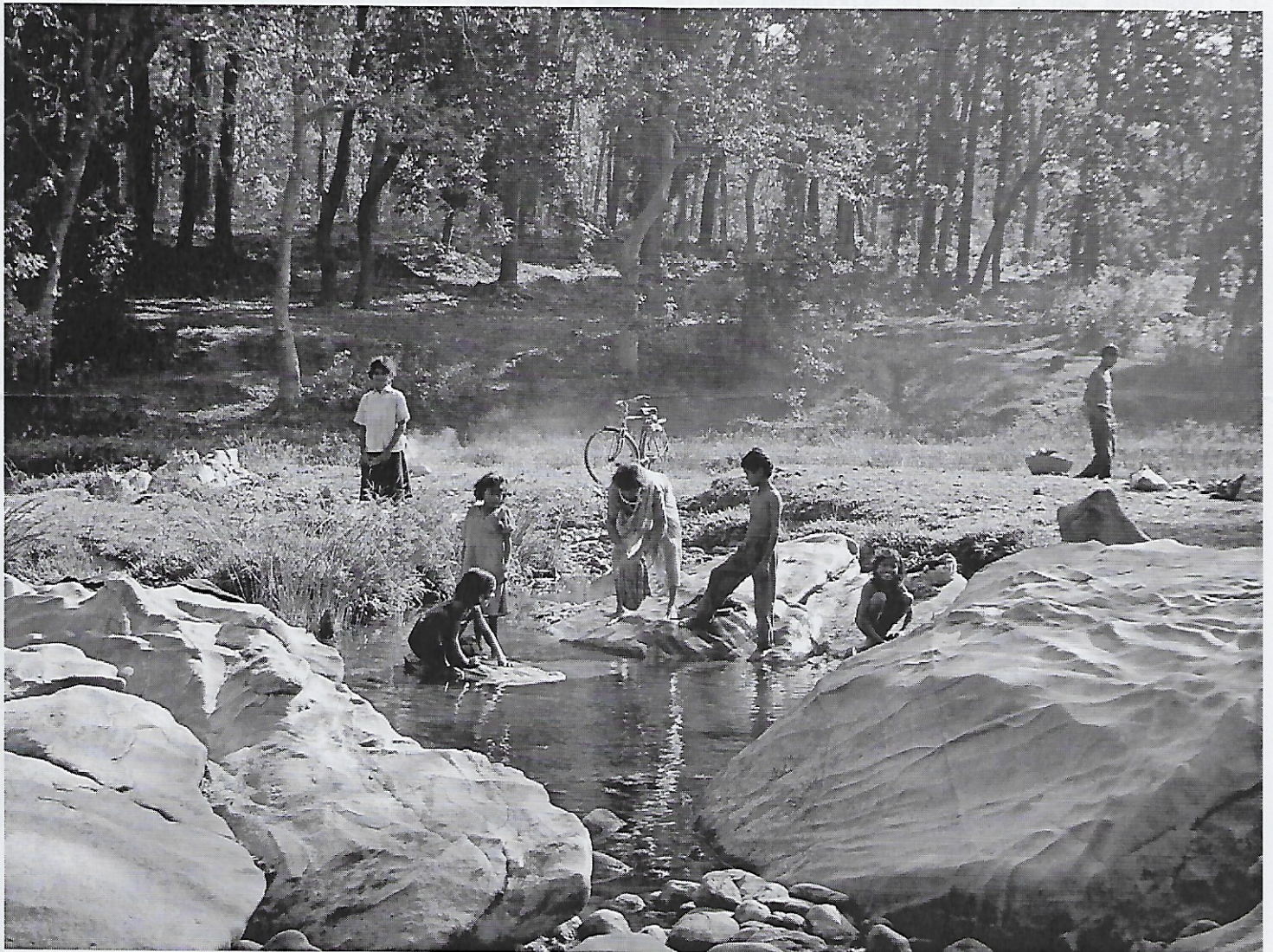
Het kletsen van wasgoed bij de rivier.