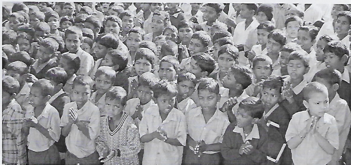
Jongens in Wadrafnagar.