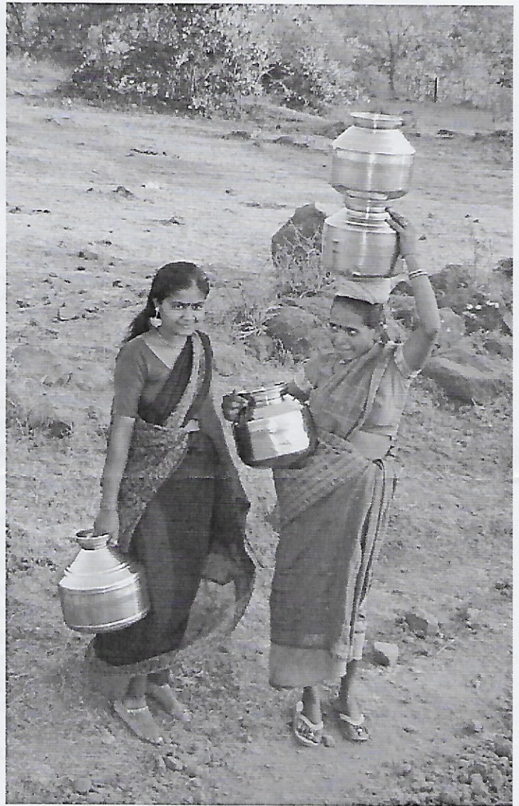
Vrouwen aan de waterput.

Father Cyril stelde voor een binnenweg te nemen, en we rijden over kleine dorpswegels langs bucolische taferelen: vrouwen aan de waterput, ossen die onvermoeibaar de molensteen doen draaien, kleine vuurtjes waarop straks de chapati's voor het avondeten worden gebakken... Is dit het jaar 1, het jaar 1000 of het 3de millennium?!