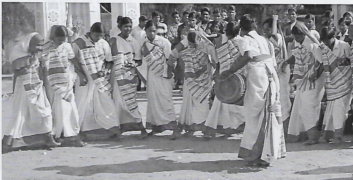
Een 'program' verveelt nooit.

Op muziek begeleidt de kleurrijke stoet ons naar onze stoelen. Als het weer stil is, kan 'the program', zoals ze dat hier noemen, beginnen: welkomstwoord, lokale dansen... We kennen het ritueel intussen door en door, en toch verveelt het nooit omdat de kinderen er zoveel toewijding, ijver en bedrevenheid in steken.