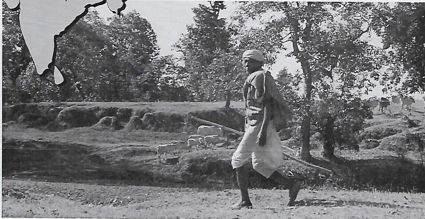
De trage, vastberaden tred van de herder.

De helderheid van de stilte, de schoonheid van de blauwende hemel bij dageraad, het vreedzame, ritmische kletsen van wasgoed bij de rivier, de trage maar vastberaden tred van de herder die weet waarheen hij gaat... een stukje paradijs, tenminste als je beslist even niet te letten op de tekenen van een armoede die wij ons zelfs niet meer kunnen voorstellen.