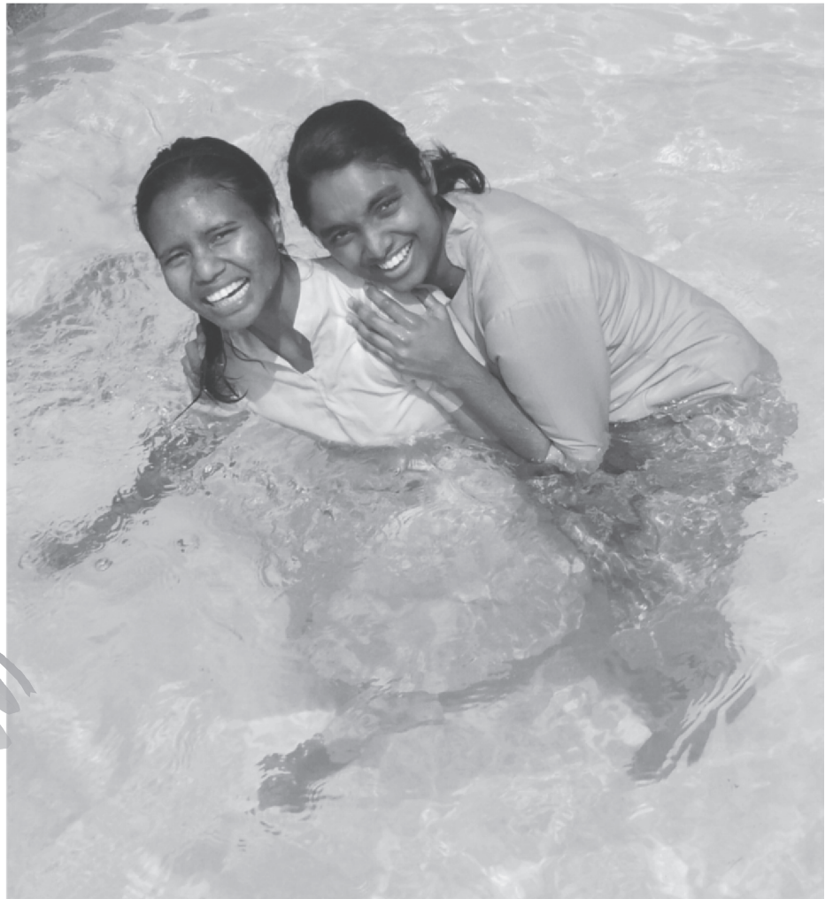
Jonge zwemmende zusters...

Maar de aflossing staat klaar, en... de resultaten zijn er.